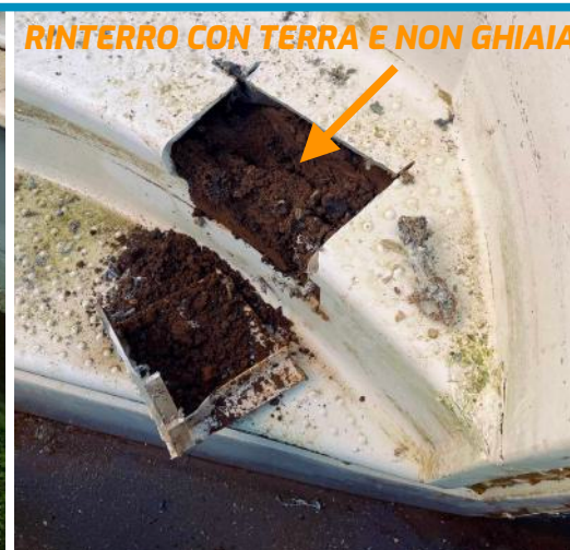
RINTERRO CON TERRA E NON GHIAIA