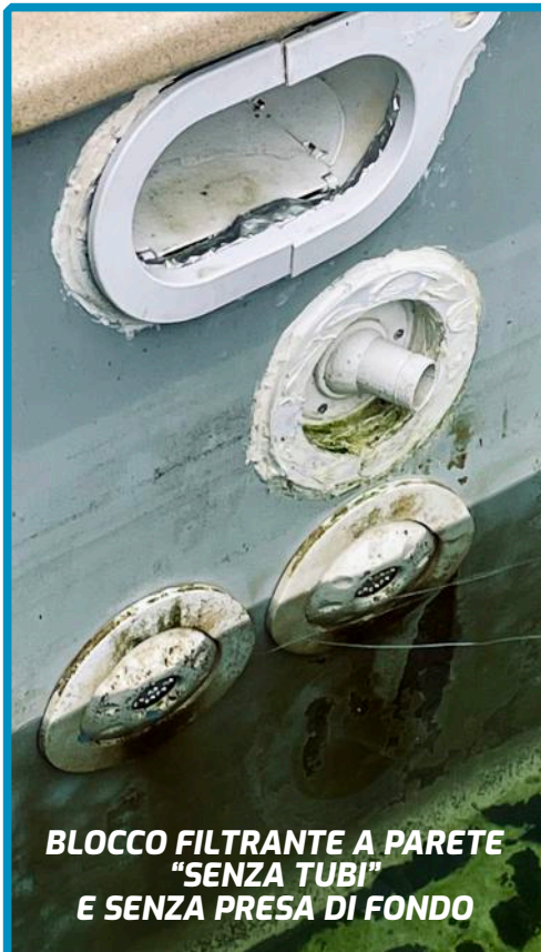
BLOCCO FILTRANTE A PARETE "SENZA TUBI" E SENZA PRESA DI FONDO