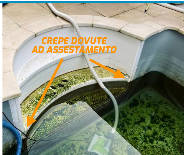
CREPE DOVUTE AD ASSESTAMENTO